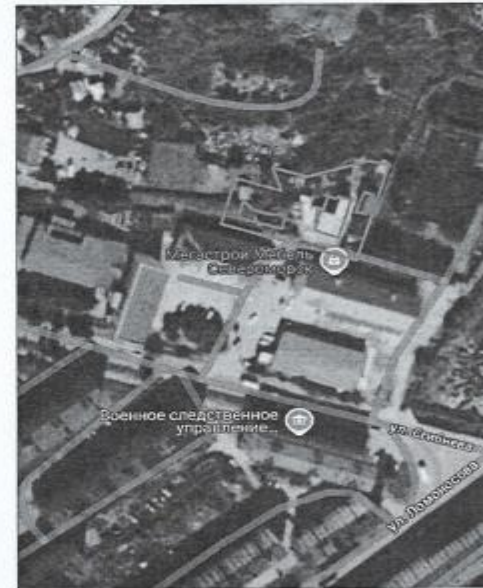
Каталог координат поворотных точек